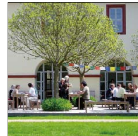
Ort der Begegnung